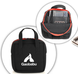
【内ポケット付き収納バッグ】