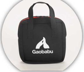
【 附带内袋收纳袋 】